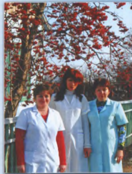
Працівники сільської амбулаторії. 2010 р.