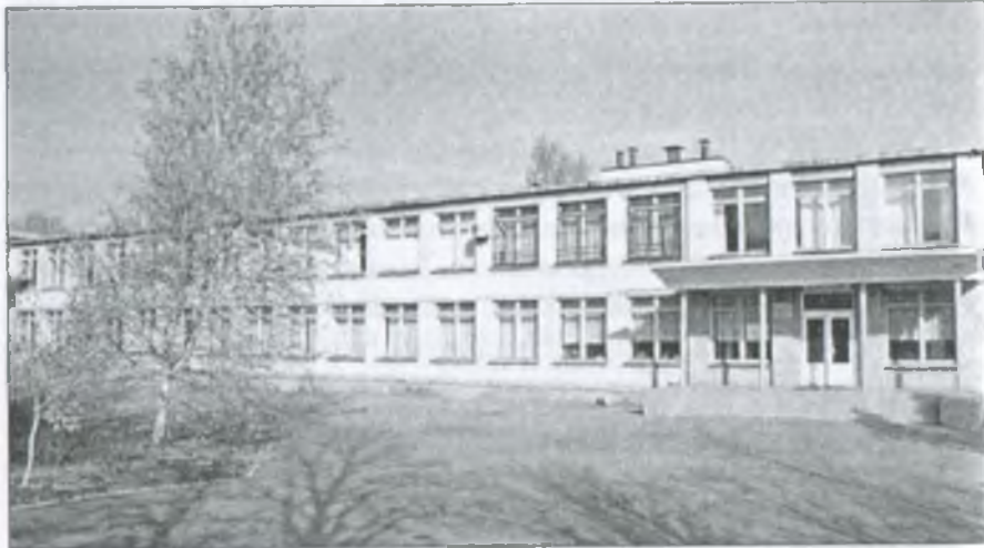
Приміщення Воздвижівського НВК. Осінь 2010 р.

Степове безмежжя тече буйною зеленавістю хлібів, мерехтить нагрітим від сонця повітрям... Степовий океан манить і кличе. Роки йдуть, часи минають, а дивом-казкою серед цього простору красується село Воздвижівка. Багато змінилося за останні десятиліття. Відбудувалося, виросло село. На заасфальтованих вулицях височіють сучасні будинки. Новим і невпізнаним став центр села з його чарівним, молодим парком та алеями. Однак душею села завжди була і залишається школа. Будь-якої пори видніється ця двоповерхова будівля серед зелені ялинок, буйного цвіту каштанів та тендітних берізок.