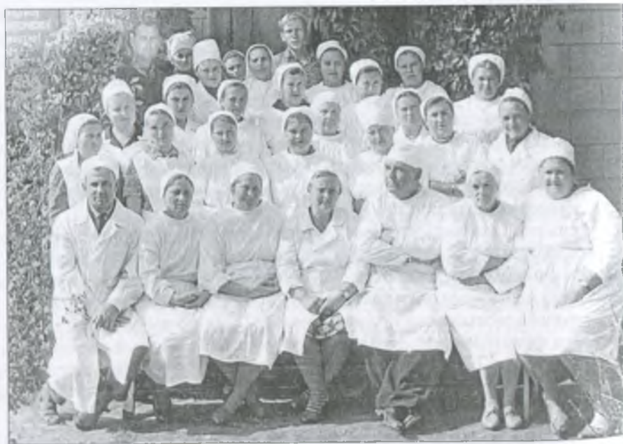
Колектив медпрацівників Воздвижівської дільничної лікарні. 1966 рік