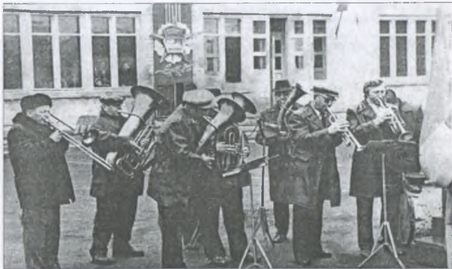
Воздвижівський духовий оркестр. 60-ті роки ХХ століття

Як же не згадати про прославлений Воздвижівський духовий оркестр, про який досі говорять на Гуляйпільщині й далеко за її межами?!