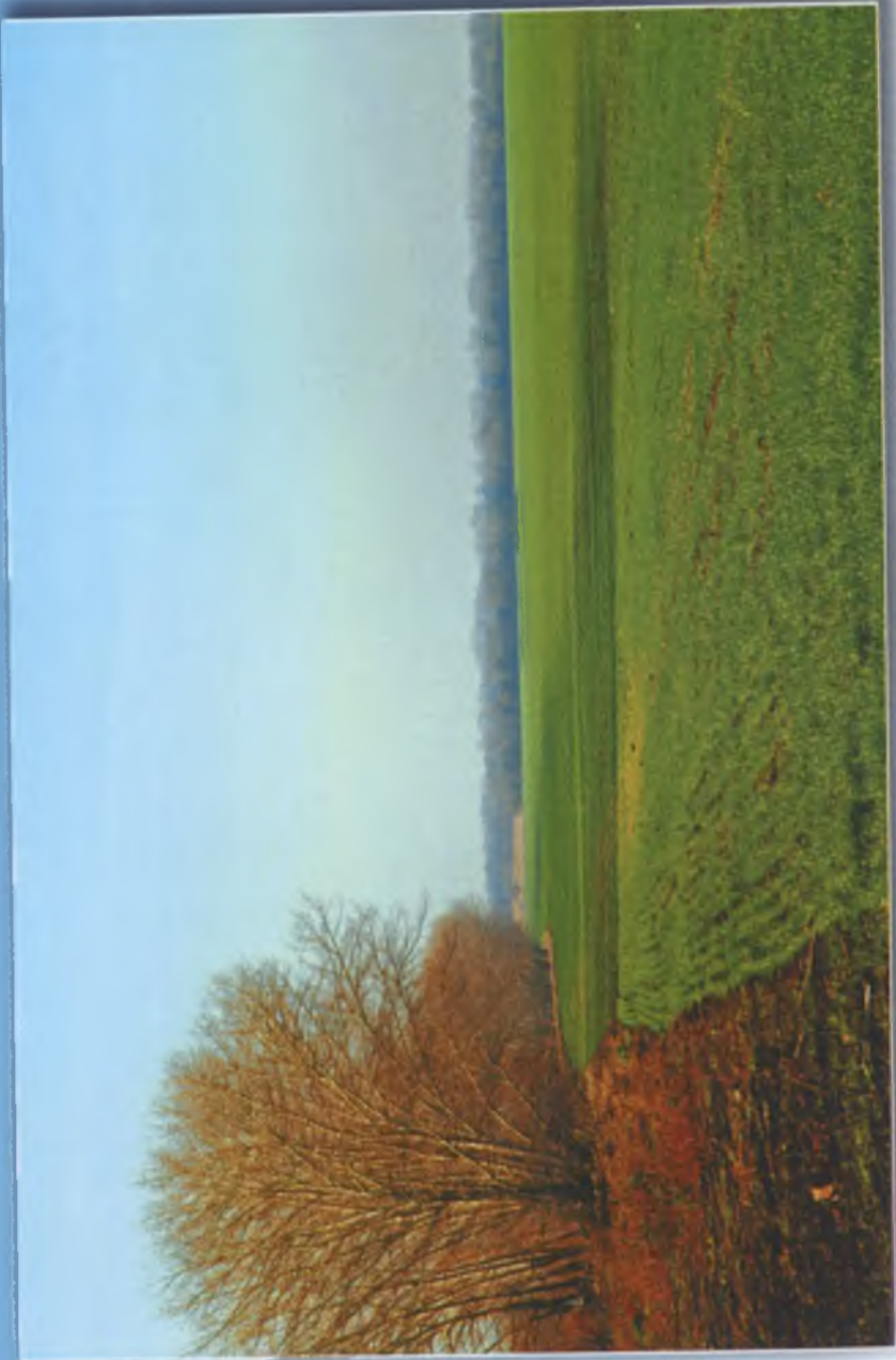
Зеленіє воздвижівська нива