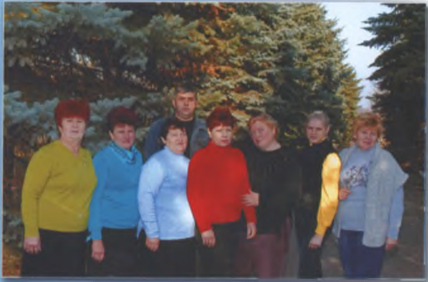
Колектив працівників сільської ради. Осінь 2010 р.