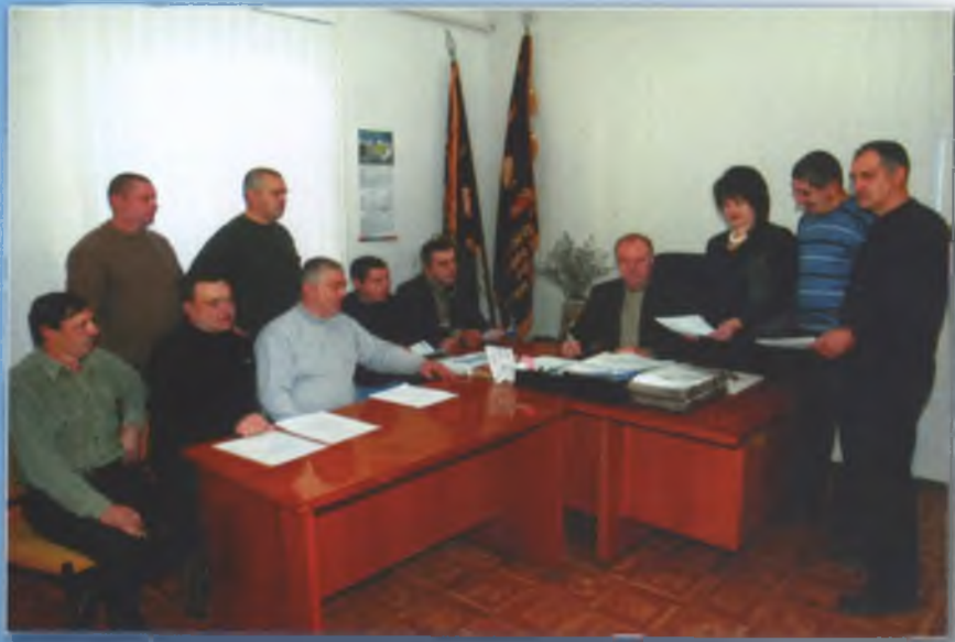
Робоча нарада із спеціалістами. 2010 р.