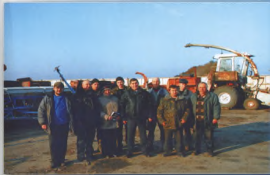
Колектив тракторної бригади № 1. 2010 р.