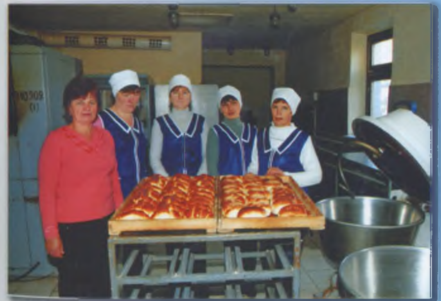
Пекарі зі своєю продукцією. 2010 р.