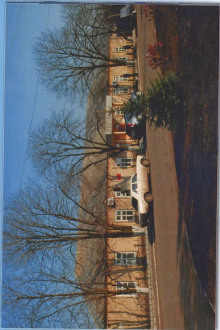
Приміщення контори ЗАТ "Агронива"