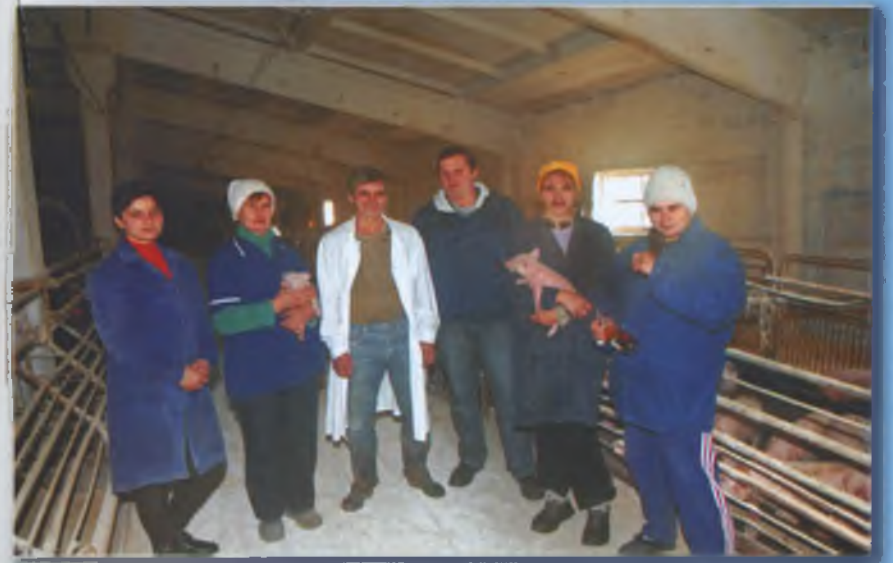
Колектив свинотоварної ферми № 3. 2010 р.