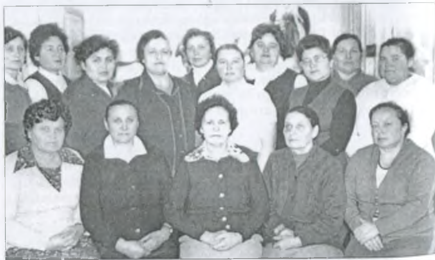
Медіраціоністки дільничної лікарні. 1989 р.