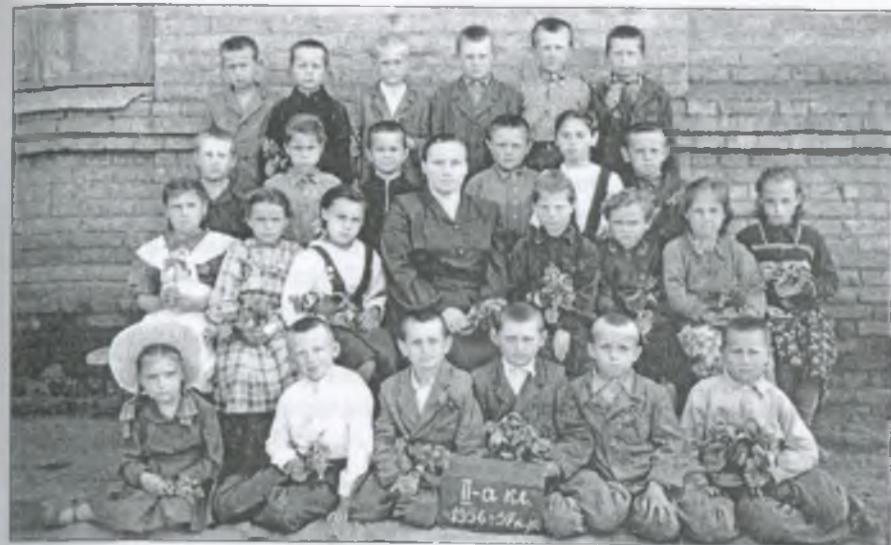
Учні 2-го-А класу із своєю вчителькою. 1956-1957 навчальний рік