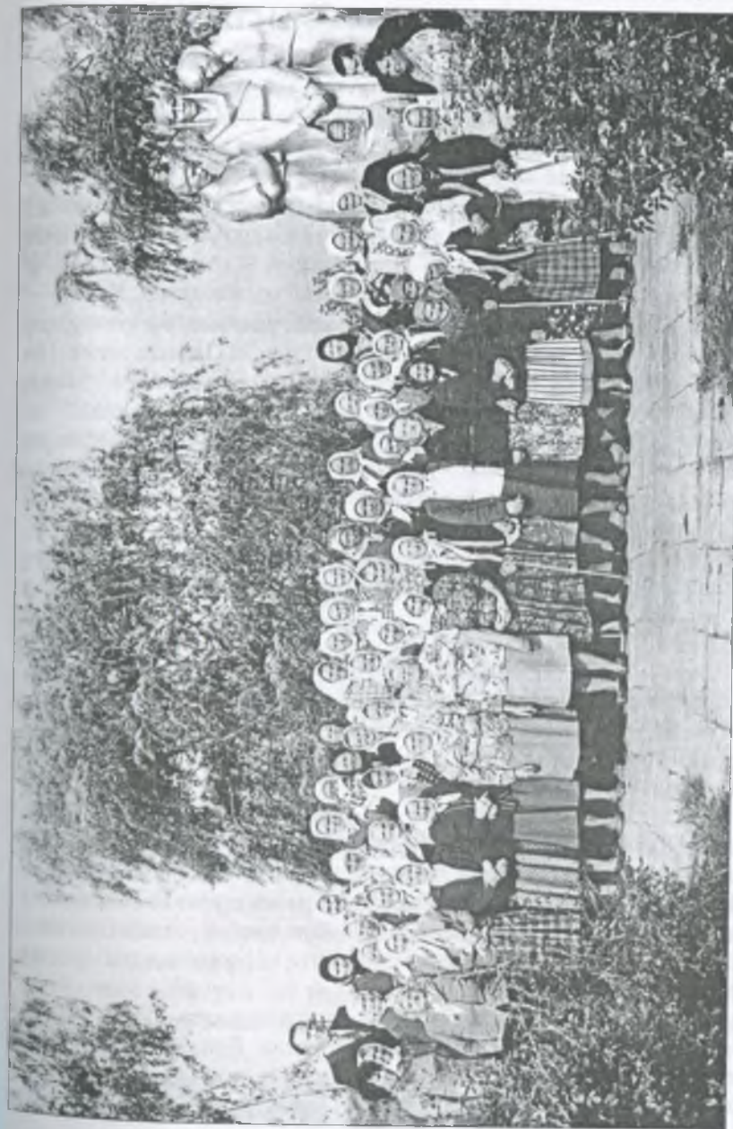
Солдатські удови на сільському меморіалі. 9 травня 1984 року

Те, що перенесли вони в роки війни, — подвиг, на який здатні лише наші жінки. Їхні руки звикли до роботи. А серця пронесли через усе життя, через усі важкі роки самотності лебедину вірність!..