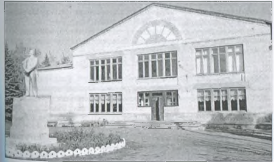
Приміщення сучасного Будинку культури. 2010 р.

Дбали жителі села і про духовний розвиток молоді. Навчали молитов, церковного співу, колядок, щедрівок, змалку знайомили з обрядами та традиціями. З покоління в покоління передавалися шана і повага до батьків, дідусів, бабусь. Батьки навчали дітей ввічливо ставитися до старших, звертаючись на "Ви".