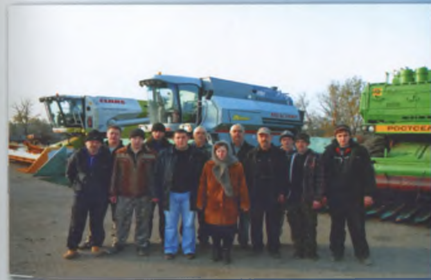
Колектив тракторної бригади № 2. 2010 р.