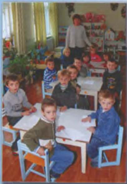
Старша група дитячого садка. 2010 р.