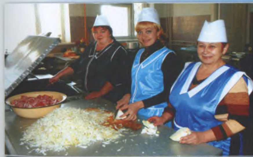
Дружний колектив їдальні