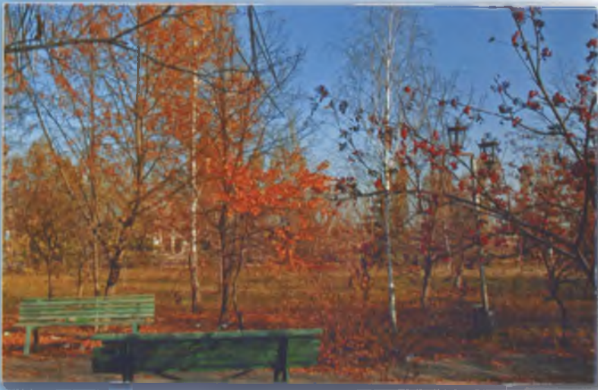
Осінь у сільському парку. 2010 р.