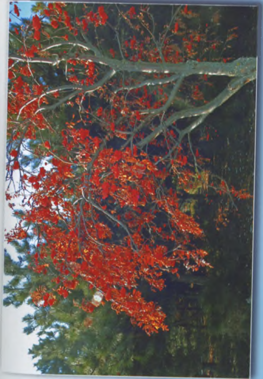
Осінь у Воздвижівці