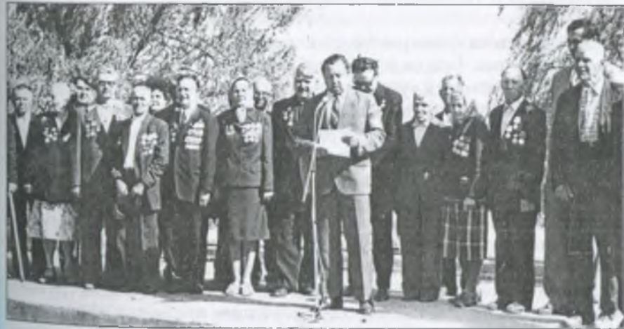
Учасники мітингу на сільському меморіалі. 9 травня 1984 р.