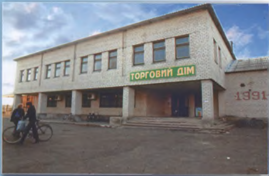
Сільський Торговий дім. 2010 р.