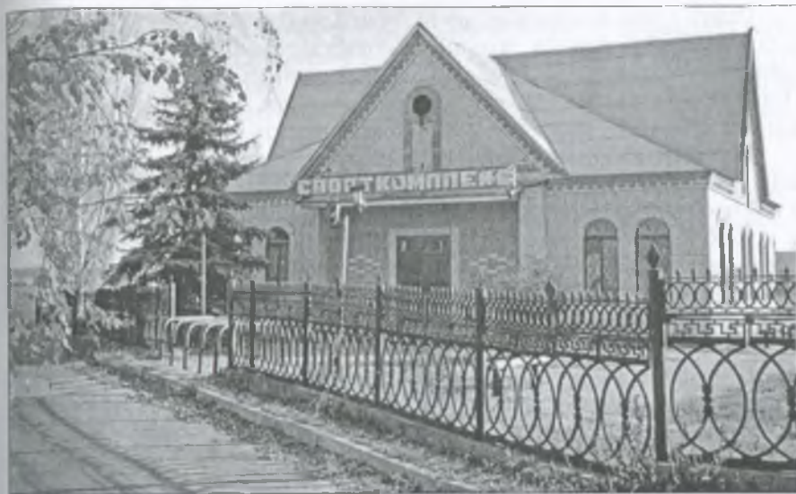
Спортивний комплекс ЗАТ "Агронива"