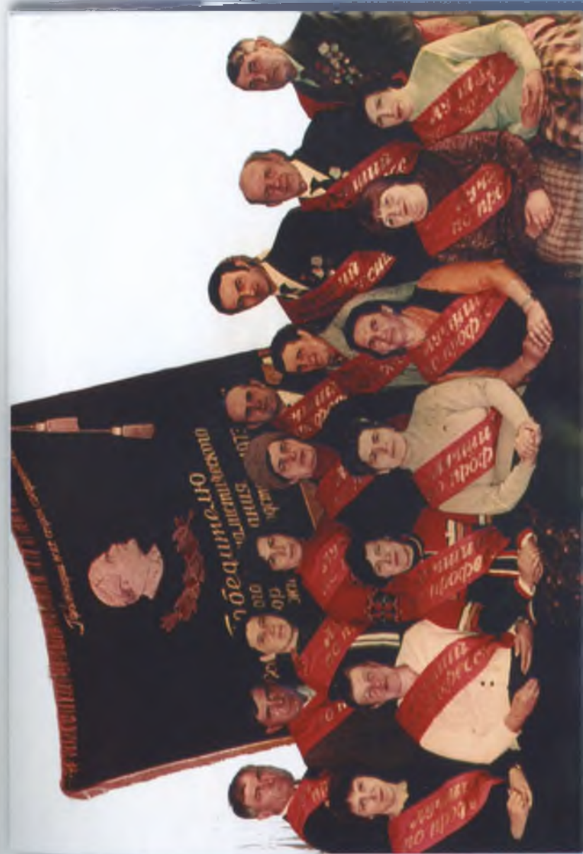
Передовики колгоспного виробництва. 80-ті роки минулого століття