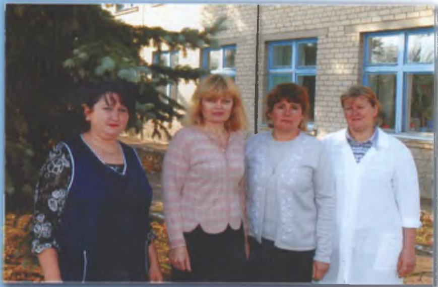
Колектив працівників дитсадка. 2010 р.