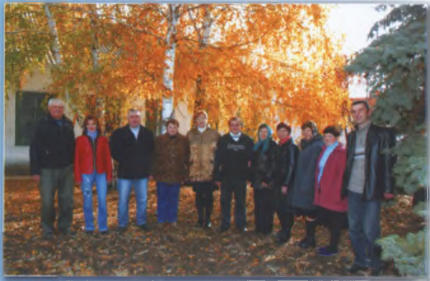
Колектив молочнотоварної ферми № 1. 2010 р.