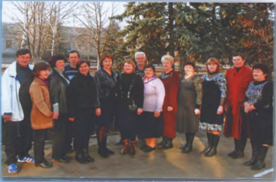
Педагогічний колектив Воздвижівської ЗОШ. Осінь 2010 р.