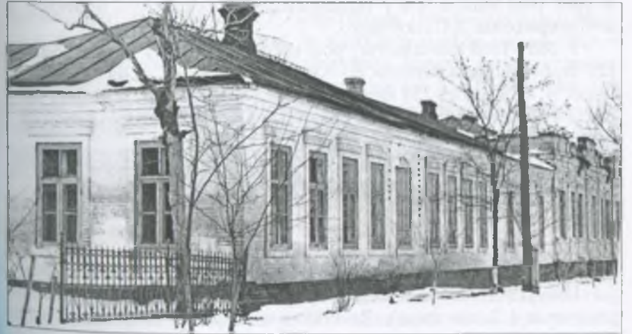
Приміщення старої Воздвижівської СШ. 1.03.1964 р.