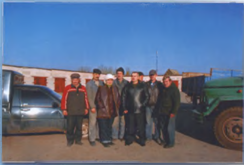
Працівники автогаража. 2010 р.