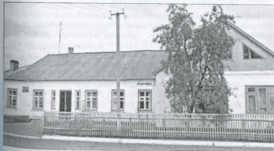
Приміщення сільської амбулаторії

Робота лікаря — більше, ніж робота. Це — високе покликання, це — особливе життя. І лікарня — то більше, ніж будівля. То — остання надія, той заклад, куди людина несе свої болі і тривоги — в надії на порятунок!..