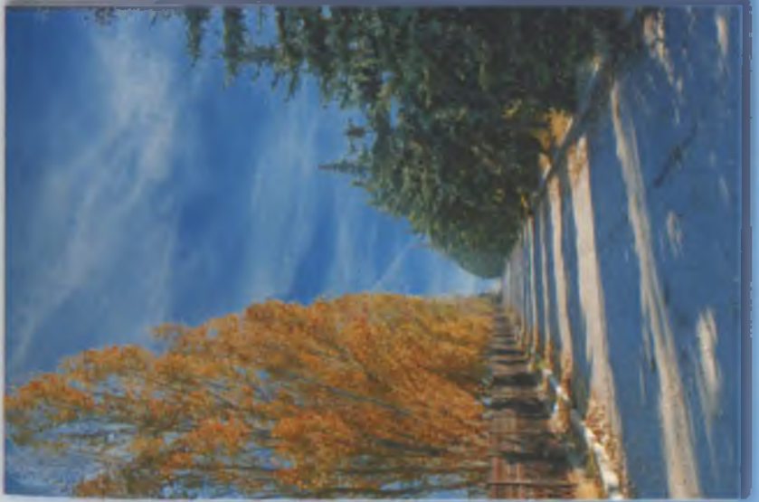
Вулиця Шевченка. 2010 р.