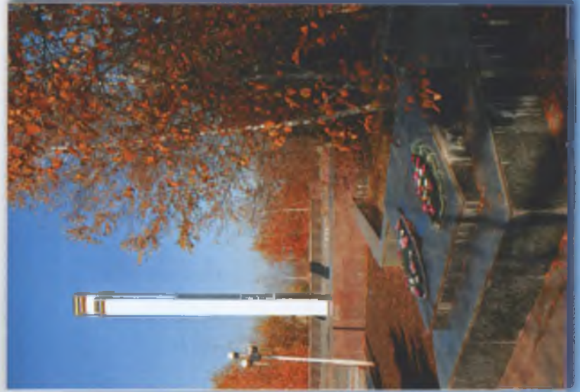
Сільський меморіал - священне місце у Воздвижівці. 2010 р.