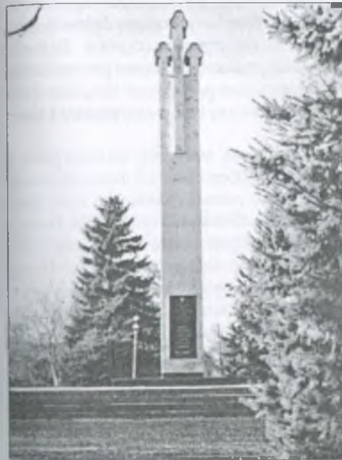
Сільський меморіал — священне місце воздвижівців