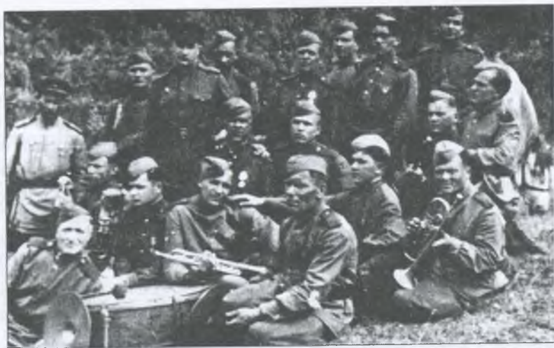
Воїни-визволителі із музичними інструментами, які після визволення у 1943 році їм подарували вдячні воздвижівці