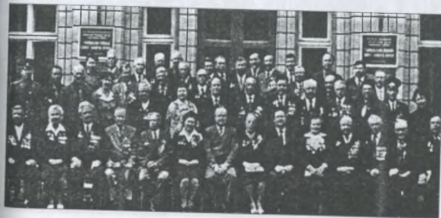
Ветерани Великої Вітчизняної війни з керівництвом району, 1985 рік