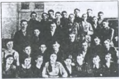
Випускники СШ № 1 1941 року, які подали заяви у військкомат із проханням зарахувати їх до лав діючої армії.

війни або в тилу ворога хоробро воювали 9000 гуляйпільців, з них 6600 не повернулось додому живими (загинули в боях, померли від ран та розстріляні фашистами), в т. ч. 454 офіцери. За ратні заслуги 6000 осіб нагороджено орденами і медалями.