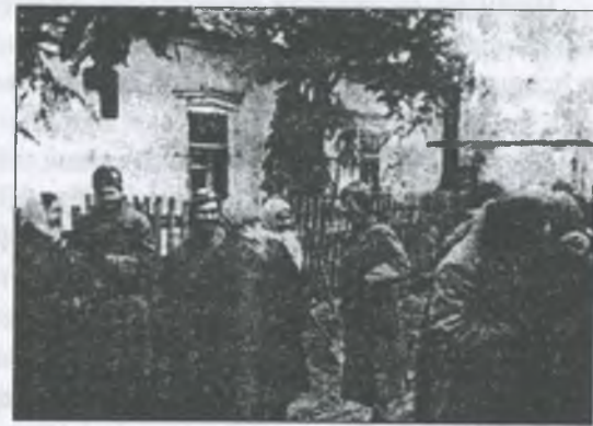
У визволеному Гуляйполі, 1943 рік

Такі зустрічі з бійцями-визволителями були часто і скрізь.