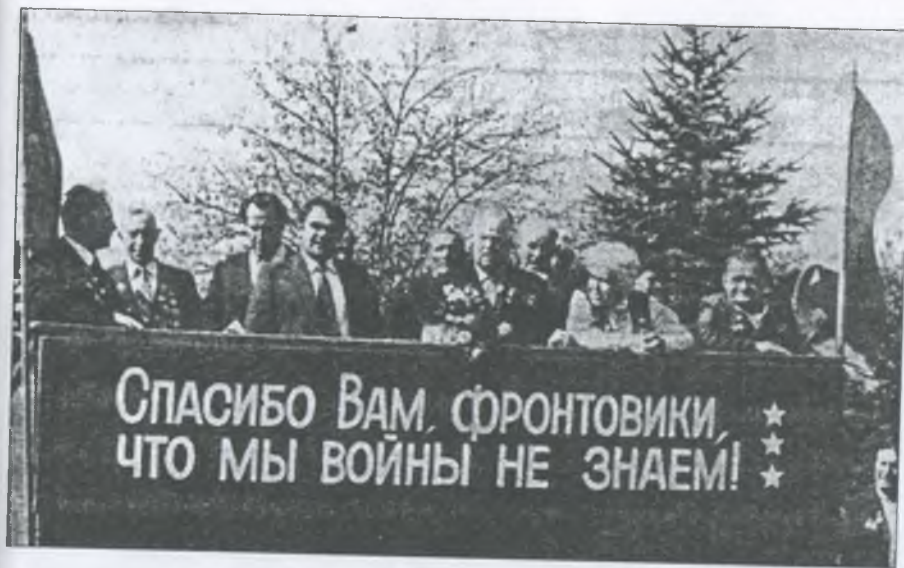
Зустріч з визволителями в селі Любимівці, 1969 рік