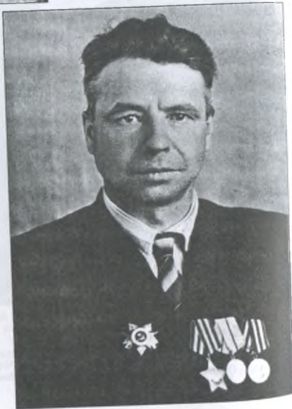
Наш земляк. Кавалер ордена Слави