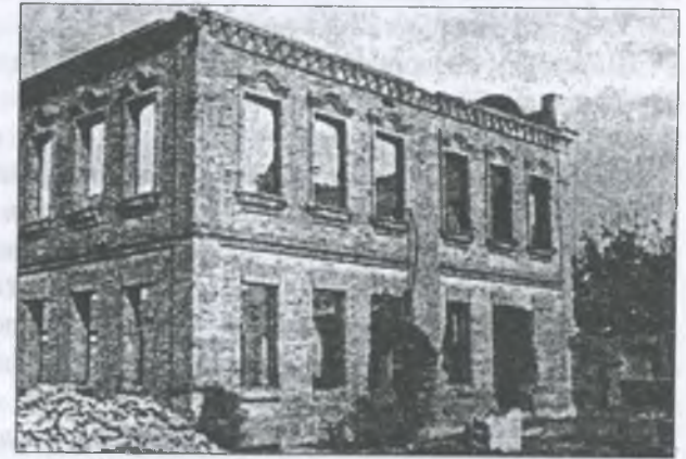
Калишні Гуляйпільська чоловіча гімназія після визволення міста, 1944 рік