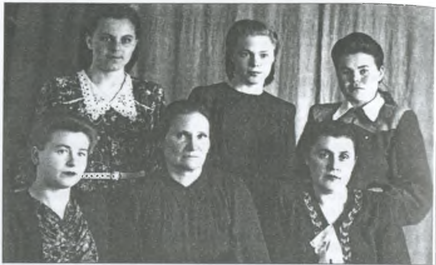
Працівники районної бібліотеки для дорослих. 10.10.1953 р.