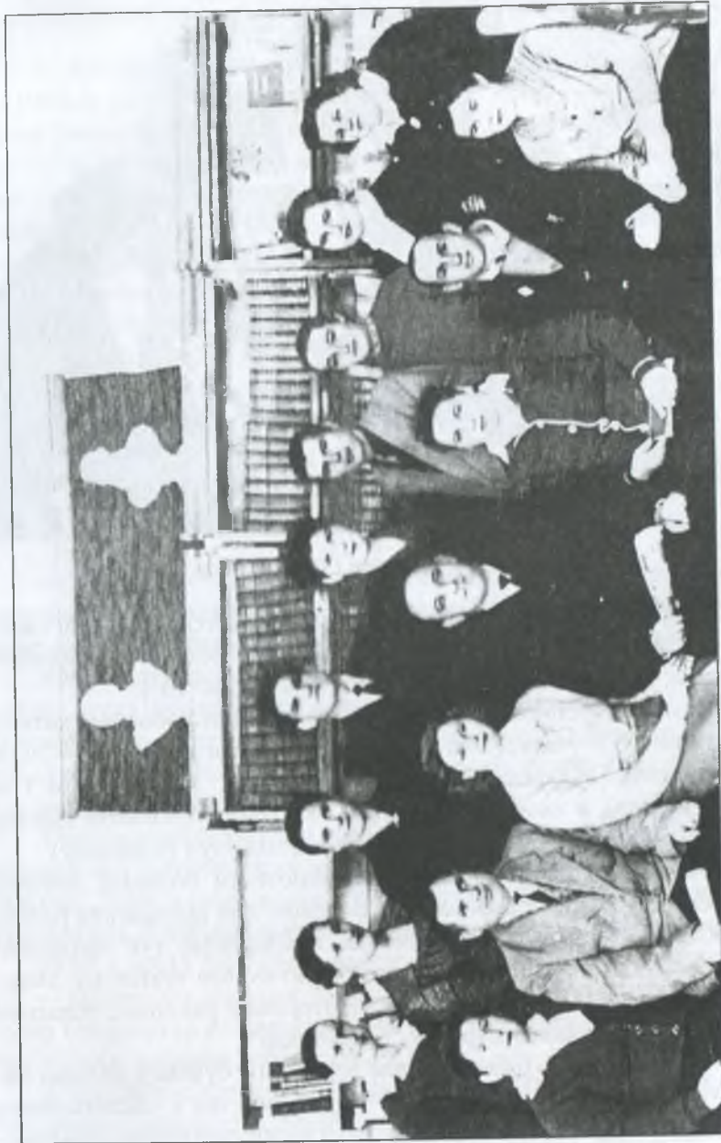
Працівники відділу культури з бібліотекарями. 08.03.1965 р.

ками різноманітних галузей літератури: суспільно-політичної, сільськогосподарської, технічної, медичної, спортивної та іншої. У великому виборі була художня література (твори класиків української, російської, зарубіжних авторів).