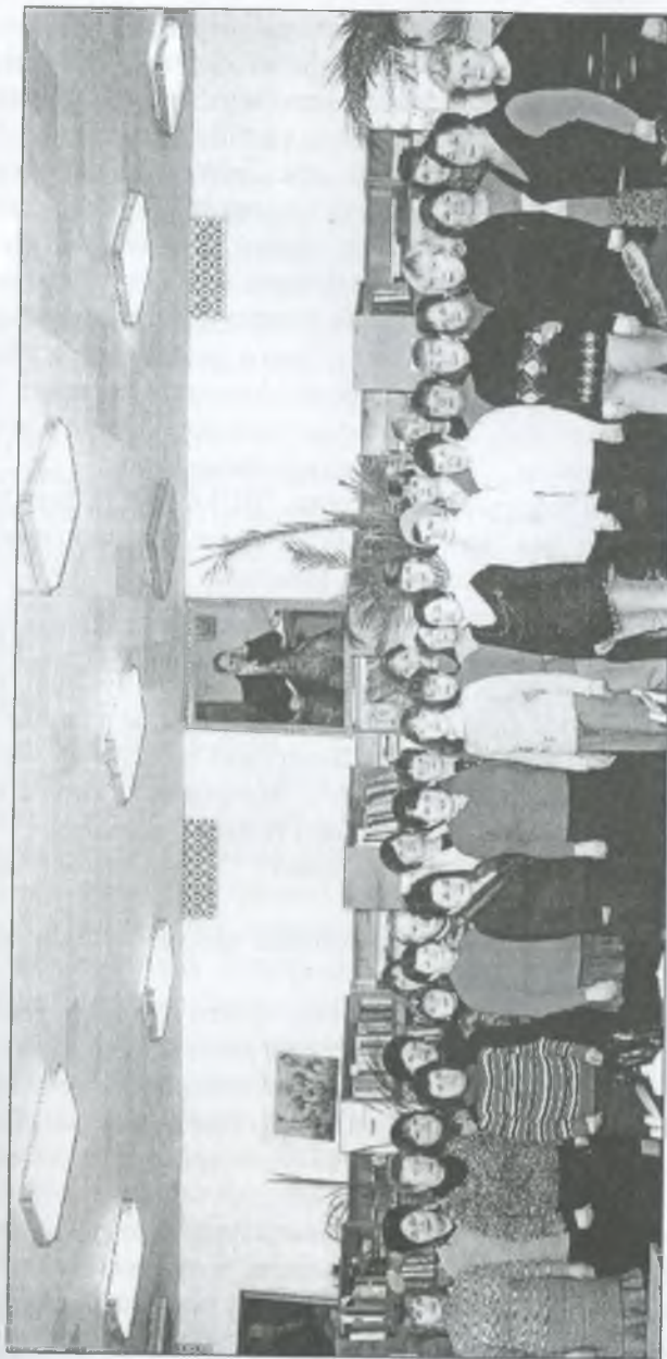
Районний семінар бібліотечних працівників Гуляйпільської ЦБС. 4.12.2009 р.

Своїми пріоритетами бібліотеки вважають комп'ютеризацію, співпрацю з органами місцевої самоврядування, впровадження нових інформаційних технологій, прагнення відповідати вимогам часу.