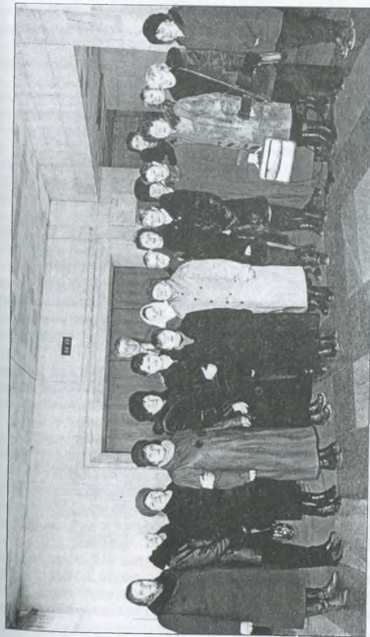
Свято працівників культури та аматорів народного мистецтва. 23.03.2005 р.