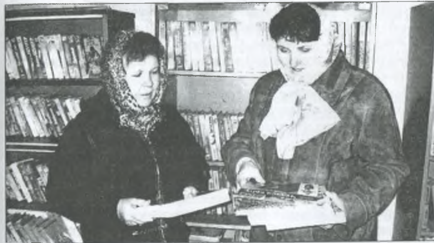
Працівники Малинівської бібліотеки. 2004 р.