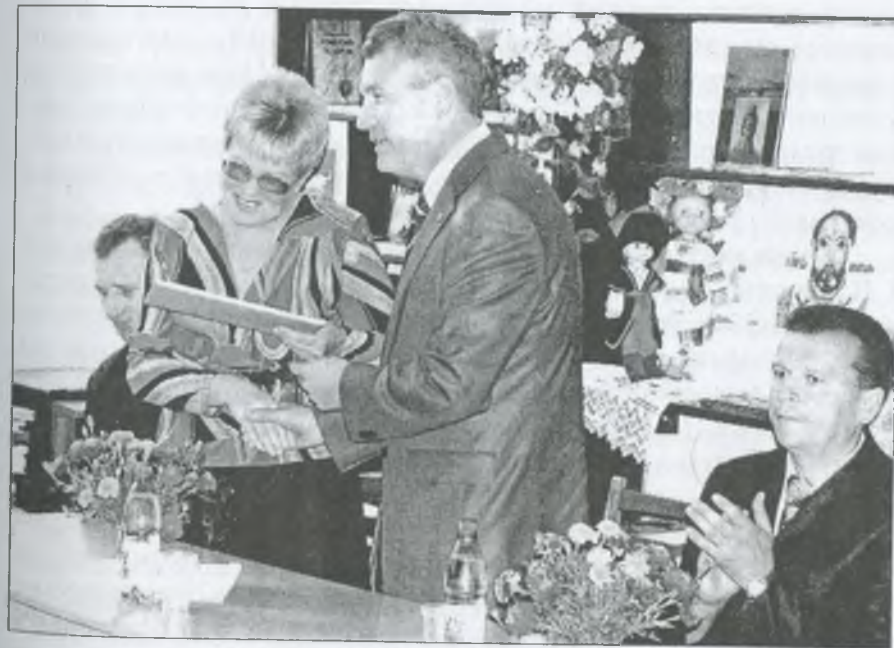
Святкування 60-річчя бібліотеки для дітей. 2009 р.

У залі — свято і чимало гостей. І линуть щирі слова вітань від голови районної державної адміністрації, депутата обласної ради О. І. Дудки, який завітав до почесних ювілярів разом зі своїм заступником П. П. Науменком.