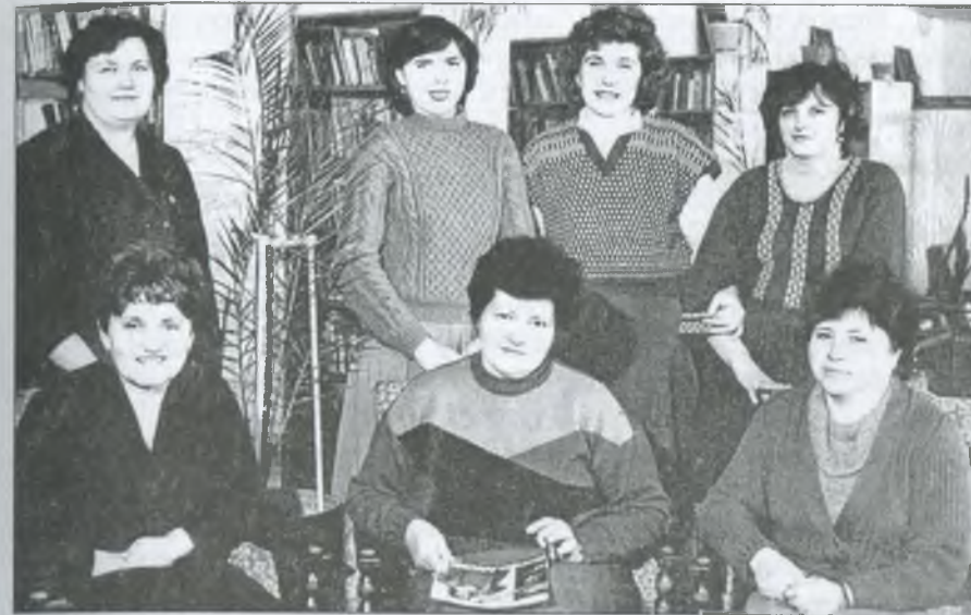
Колектив райбібліотеки для дорослих. Грудень 1989 р.

Диспути і бесіди, колективні читання і обговорення цікавих матеріалів — це лише невеликий перелік культурно-масових заходів.