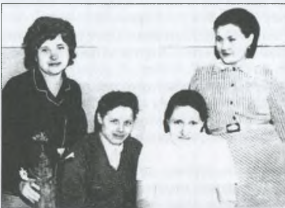
Колектив райбібліотеки для дорослих. 1972 р.

У лютому 1976 року в районному Будинку культури відбувся вечір, присвячений XXV з'їзду КПРС і XXV з'їзду Компартії України".