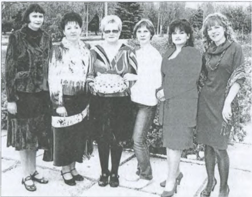
Колектив районної бібліотеки для дітей, 2009 р.

Твір-казка дівчини про країну Лісотропію полонила серця киян і дівчину викликали в столицю на церемонію нагородження.