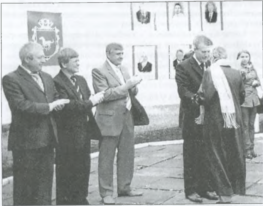
Колектив бібліотеки для дітей занесено на району Дошку Пошани

Тісно співпрацюємо з колективом редакції "Голос Гуляйпільля". На її сторінках публікуємо матеріали про заходи, які проводимо в бібліотеці. На них часто присутні журналісти газети. Так рекламуємо нашу бібліотеку.