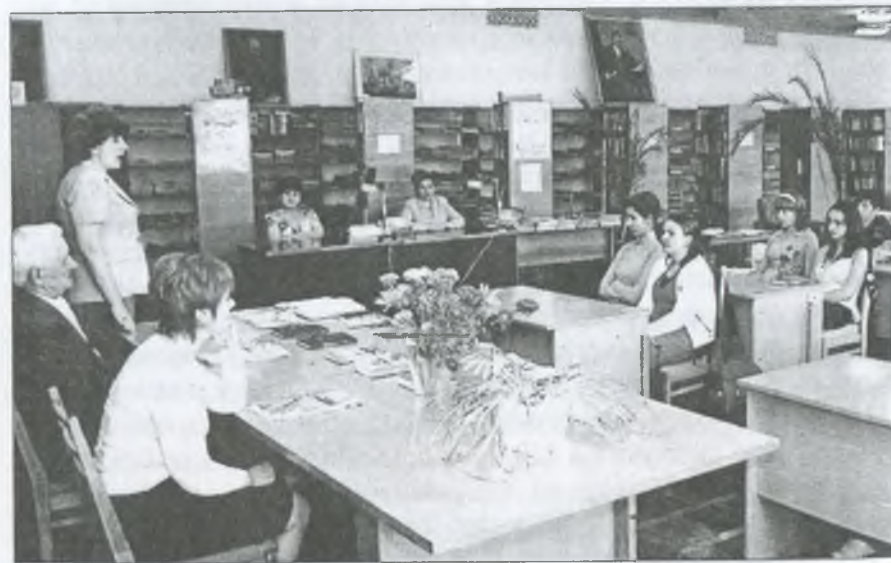
Зустріч у райбібліотеці

Тут читачі могли познайомитися з літературою авторів-земляків; із книгами про наших славних людей Гуляйпільщини, про місцевий фольклор, про розвиток сільгоспідприємств, товариств та ін.