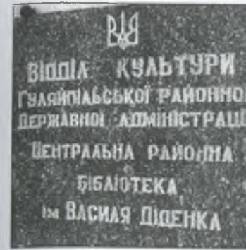
Бібліотека імені В. Діденка