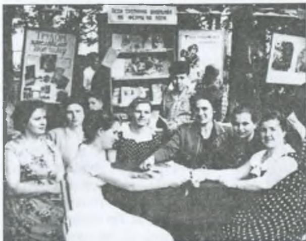
Свято книги в м. Гуляйполі. 1963 р.

Поруч з читальнями обладнаний спеціальний "Куток юного книголюбів". Тут же, на алеї квітів — казковий будинок.