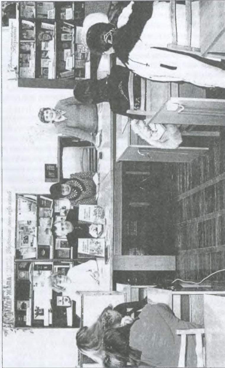
Читацька конференція у районній бібліотеці для дорослих. 18. 03. 2010 р.

сьогодні, завтра", "Здорове довкілля — це щедра і щира душа". Простір бібліотек оформлено квітами — це викликає почуття приєднання до прекрасного світу живої природи. Так ненав'язливо виникає контакт з прекрасним. Разом з цим проведено інформаційні години: "Збережемо рідну землю голубою і зеленою", "Люди і природа", "Наша планета — живий дім", "Людино, хто ти на землі", "Осінь — багатство нашого буття".