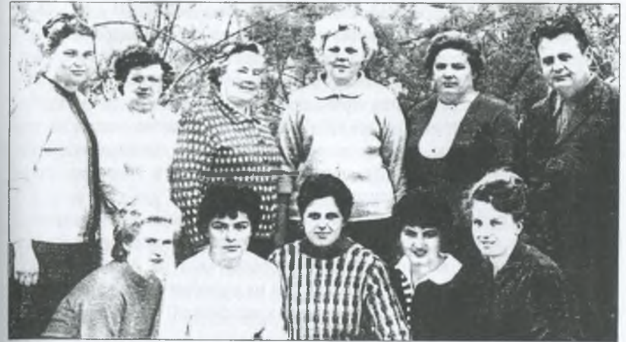
Працівники райбібліотеки з преставниками культури з Кієва і Запоріжжя. 1967 р.

В 1971 році в район приїздила начальник бібліотек Міністерства культури З. А. Печенізька у супроводі директора обласної бібліотеки А. І. Бельцера. Заслухавши інформацію про досвід Гуляйпільської районної бібліотеки для дорослих і визнавши його позитивним, Міністерство прийняло постанову, яка рекомендувала поширити цей досвід в областях з відповідною наявністю малих населених пунктів.