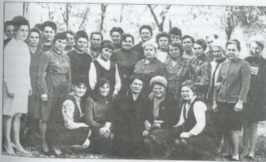
Обласний семінар на базі Гуляйпільської бібліотеки для дітей. 19.10.1970 р.