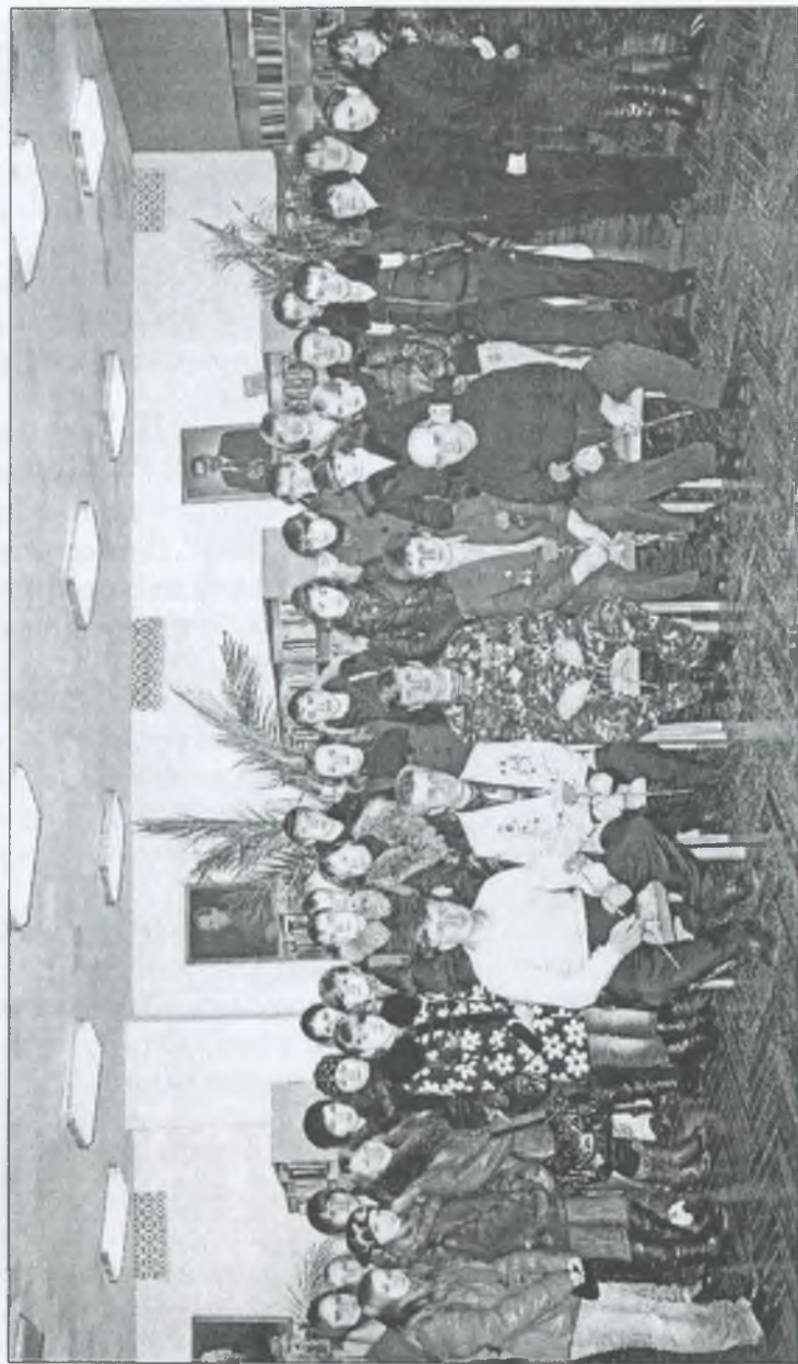
У райбібліотеці для дорослих після зустрічі з воїнами-інтернаціоналістами. 16.02.2010 р.