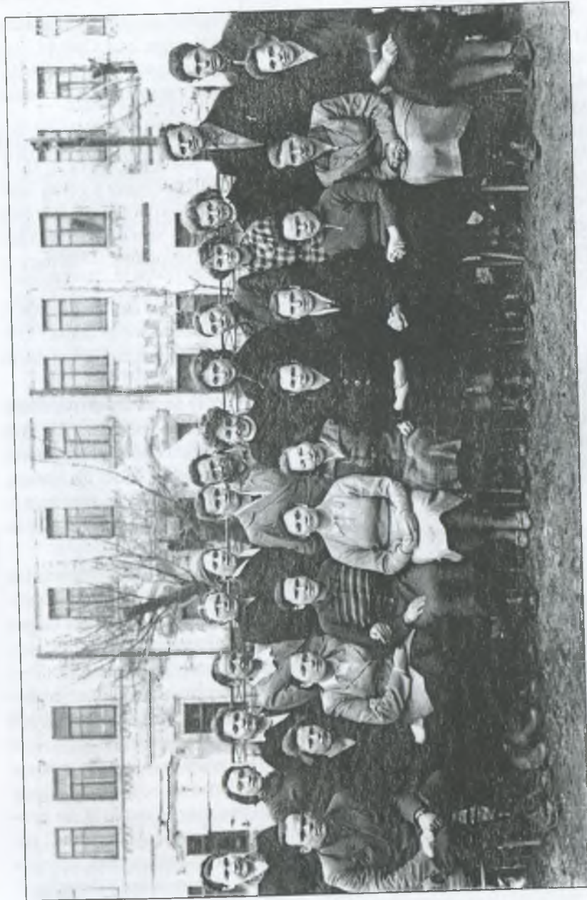
Семінар культпрацівників Гуляйпільського району. Березень 1960 р.

Не в кожному населеному пункті поки що є стаціонарні бібліотеки. Однак, вже декілька років тому бібліотечні працівники охопили читанням всі населені пункти. В бригадах, на тваринницьких фермах, в польових станах організовано понад 130 пунктів видачі книг та пересувок. Але життя вимагає нових форм обслуговування читачів. В пошуках ми прийшли до висновку: перш за все необхідно взятися за реорганізацію нестационарного обслуговування населення книгами. Ми вивчили досвід інших бібліотек країни, разом міркували, як краще задовольнити запити читачів.