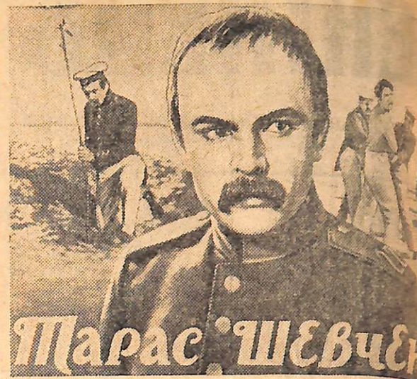
На знімку: кадр з кінофільму „Тарас Шевченко“.

голова районного комітету у справах фізкультури і спорту.