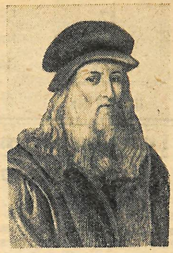
Леонардо да Вінчі—великий італійський художник і учений. 15 квітня 1952 року відзначалося 500 років з дня його народження (1452). Помер 2 травня 1519 року.

К. ДЕНИСЕНКО, завідуючий відділом культосвітніх установ.