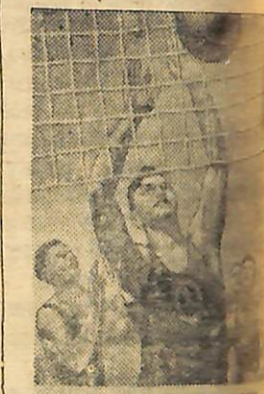
КОЖНОМУ КОЛГОСПУ ФІЗКУЛЬТУРНИЙ КОЛЕКТИВ

Однак в ряді спортивних колективів підготовка до відкриття літнього спортивного сезону проводиться вкрай незадовільно. Це особливо стосується низових спортивних