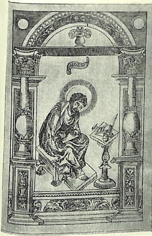
Фронтиспис с изображением Луки, легендарного автора «Апостола». Это была первая художественная гравюра на дереве, помещенная в книге.