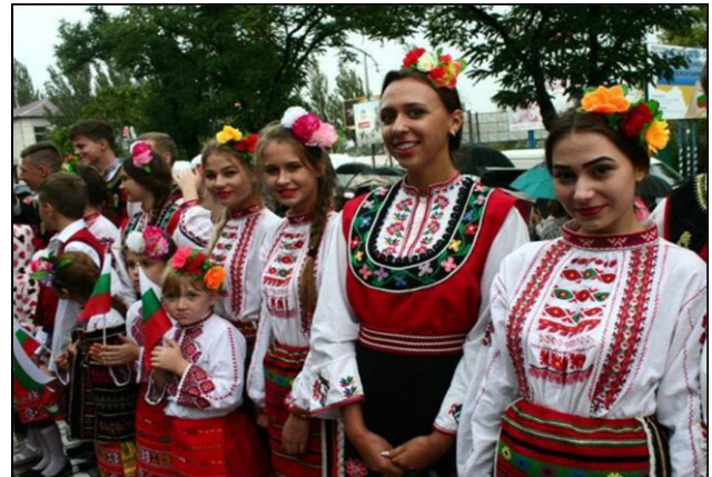
Відзначення річниці переселення болгар до Таврії у 2017 році

зв'язків та творчої співпраці. Національно-культурні товариства успішно проводять наукову, просвітницьку, культурну роботу в плані вивчення рідної мови, збереження традицій, активно підтримують патріотичні акції, наших бійців на сході країни та соціально незахищені верстви населення. У Запорізькій області успішно діє «Програма підтримки розвитку культур національних меншин у Запорізькій області на 2018-2022 роки», завдання якої – сприяти активній взаємодії всіх без винятку представників різних національностей, народів, які проживають на нашій землі й створюють єдину родину Запорізького краю. Важливою передумовою подальшої консолідації української нації є врахування регіональних та локальних особливостей народної культури. Основною умовою утвердження миру і злагоди в українському суспільстві, одним із невідкладних спільних завдань держави і суспільства є захист прав усіх етнічних спільнот, збереження і розвиток їхньої національної самобутності.