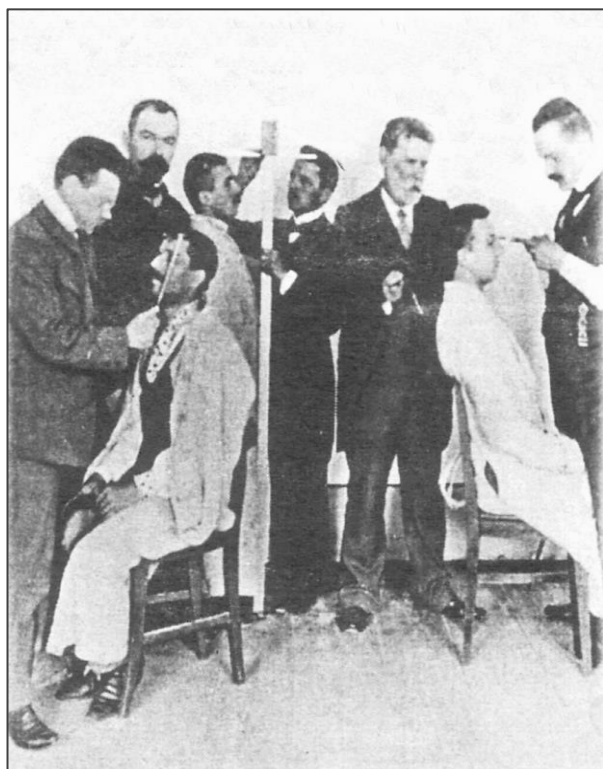
Антропометричні дослідження Хв. Вовка

Тян-Шанського, кавалером найвищої нагороди Франції – ордена Почесного легіону, членом понад десятка міжнародних наукових товариств і комісій. Попри світове визнання учений постійно зазнавав тиску від влади. Федір Вовк доклав багато зусиль у створенні величезних цінних українських колекцій, які, нажаль, знаходяться у російському музеї.