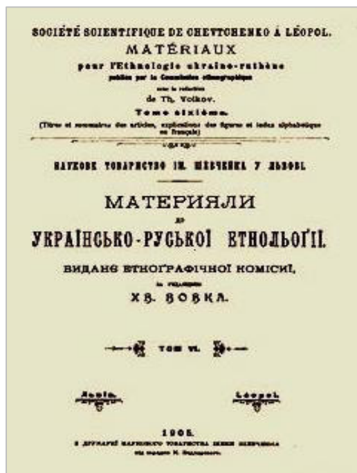
Видання Етнографічної комісії

Оскільки духовне життя України тривалий час принижувалося не лише на офіційному рівні, а й за допомогою псевдонаукових концепцій, українська етнографічна школа зароджувалася на народознавчій основі. Її витокami стали фольклор, народне мистецтво та література. Майже всі українські письменники були етнографами, які вивчали народне життя. Іван Котляревський через «Енеїду» показав колорит народної матеріальної та духовної культури українців; Григорій Квітка-Основ'яненко, окрім художніх етнографічних творів, видав кілька наукових праць, у тому числі велику статтю «Українці»; Тарас Шевченко, як співробітник Археологічної комісії Київського університету, здійснив наукові експедиції зі збирання етнографічного матеріалу. До когорти письменників-етнографів належали: Іван Нечуй-Левицький, Леся Українка, Іван Франко, Пантелеймон Куліш та ін.