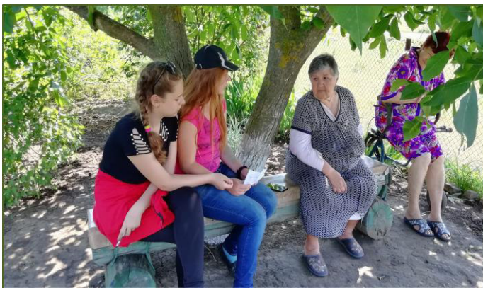
Проведення інтерв'ю гуртківцями КЗ «Центр туризму ЗОР

Всіх потенційних свідків чи носіїв історичної пам'яті опитати неможливо, тому перед тим, як перейти до пошуку респондентів, необхідно визначити вибірку їх сукупність з метою подальшого обґрунтування висновків. Зазвичай, експедиція орієнтується на опитування мешканців населеного пункту старшого віку, але й