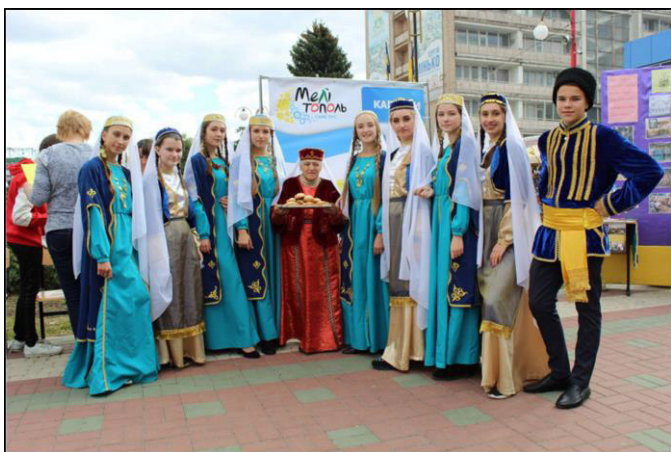
Члени караймської громади м. Мелітополя

Традиційно-побутова культура Півдня України сильно таврована зловісним впливом імперської русифікаторської експансії царизму та її новітніх не менш агресивних послідовників.