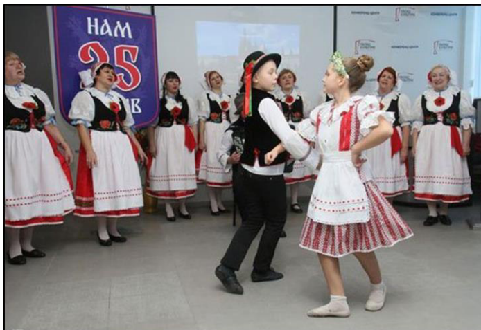
Свято чеського товариства у Мелітополі

Як приклад такої політики, в області активно працює Координаційна рада громадських об'єднань національних меншин, до якої увійшли представники 28 національно-культурних товариств. Визначними подіями для області було відзначення 155-річчя переселення болгар до Таврії у містах Запоріжжя та